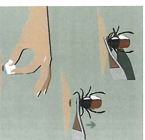
Método para la extracción de la garrapata

En los días siguientes a la picadura, observa si aparece fiebre y/o erupción en la piel y, si esto ocurre, busca atención médica indicando que te picó una garrapata.